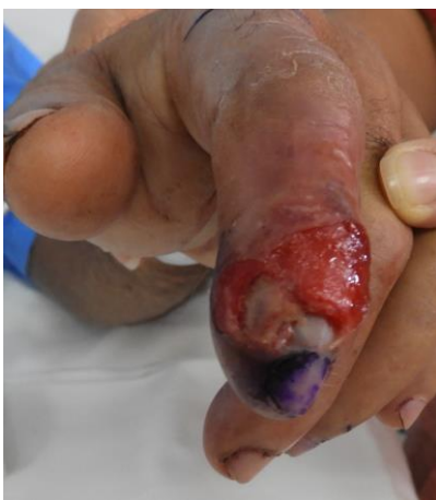
Figura 1. Sitio de mordedura: Úlcera en falange distal y medio del segundo dedo de la mano izquierda con pérdida de sustancia.

Un paciente masculino de 58 años sin antecedentes patológicos conocidos; sufrió una mordedura por serpiente a nivel de la falange distal del segundo dedo de la mano izquierda mientras realizaba labores agrícolas en la comunidad de Matina en la provincia de Limón. Fue llevado al servicio de emergencias del hospital Tony Facio de Limón donde se le administró el antídoto polivalente aproximadamente 6 horas tras la mordedura inicial. No se detalló las características de las serpientes, pero por los cambios locales de eritema y edema a nivel del falange, orientaron a los médicos tratantes a pensar en la opción de una serpiente del género Bothrops sp. por lo cual administraron el antídoto ante la historia aportada. No se presentaba en este momento ningún síntoma neurológico. Al ingreso se documentó hemoglobina en 12.0 g/dL, plaquetas normales sin leucocitosis (10590 /fl con 91% de segmentado), proteína C reactiva en rango normal, procalcitonina en 1.11, TPT en 45 segundos y TP en 69%. Tuvo función renal normal y hemocultivos negativos.