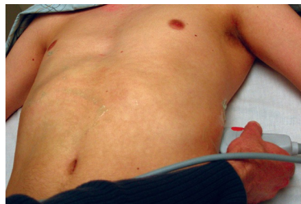
Figura n 4

en el cuadrante superior derecho. Una distinción importante es que el riñón izquierdo se encuentra generalmente en una ubicación más posterior y superior. Por lo tanto, para obtener una imagen coronal, el transductor se coloca en la línea axilar posterior entre las costillas 8° y 11°. El indicador debe estar orientado hacia la cabeza del paciente. Es particularmente importante no sólo para evaluar la interfaz entre el riñón y el bazo, sino también para buscar la interfaz entre el bazo y el diafragma. Esto ayuda en la visualización de la cavidad pleural costofrénica para el líquido libre pleural, así como el receso subfrénico, donde se acumula el líquido libre peritoneal. Una vez que se ha obtenido la vista coronal, el transductor debe moverse anterior y posteriormente para evaluar plenamente el cuadrante