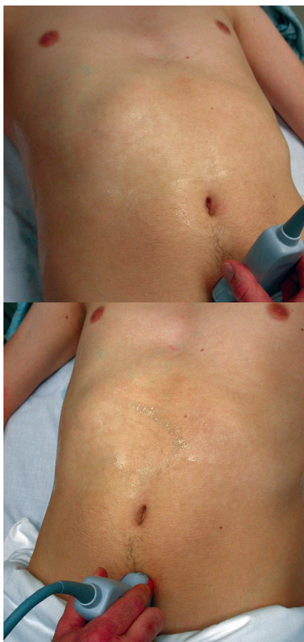
Figura 5 La colocación del transductor para la evaluación de la pelvis en una orientación transversal. Tenga en cuenta que el indicador está apuntando hacia la derecha del paciente. Figura 6 La colocación del transductor para la evaluación de la pelvis en una orientación sagital. Tenga en cuenta que el indicador está apuntando hacia la cabeza del paciente. (1)