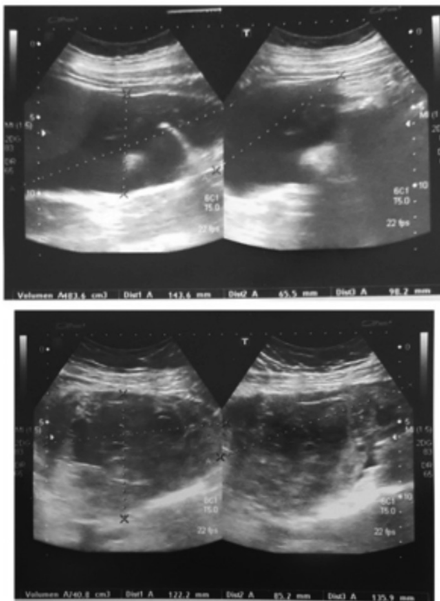
Figura 1. Hematoma intraabdominal

ni sepsis. Los exámenes de laboratorio reportan una Hb 11.1 g/dL y una leucocitosis de 21000 uL (PMN: 92%). Se solicita un US abdominal el cual reporta una imagen compatible con un hematoma de aproximadamente 740cc a nivel pélvico parauterino derecho y abundante cantidad de líquido libre de aspecto hemático en correderas y pelvis con un volumen aproximado de 1000cc ( Figura 1 ), por lo que se solicita valoración ginecológica. US ginecológico y valoración reportan una colección en fosa iliaca derecha (FID) de 108x114mm que entra en contacto con el fondo uterino, útero y ovarios normales y de aspecto grumoso ( Figura 2 ), hallazgo sugestivo de probable plastrón apendicular. La paciente es llevada a sala de operaciones donde se documenta un quiste hemorrágico roto de ovario izquierdo, de aproximadamente 12 cm, el cual diseca hacia FID sin comprometer la cavidad pélvica con útero y ovario derecho sin alteraciones, un hemoperitoneo de 1000cc y una apéndice cecal sin complicaciones. Se procede a realizar una salpingooforectomía izquierda y salpingectomía derecha por afectación de la misma. Al día siguiente se documenta una hemoglobina en 7.8 g/dL por lo que se decide transfundir hemoderivados. Se egresa a los 6 días sin complicaciones.